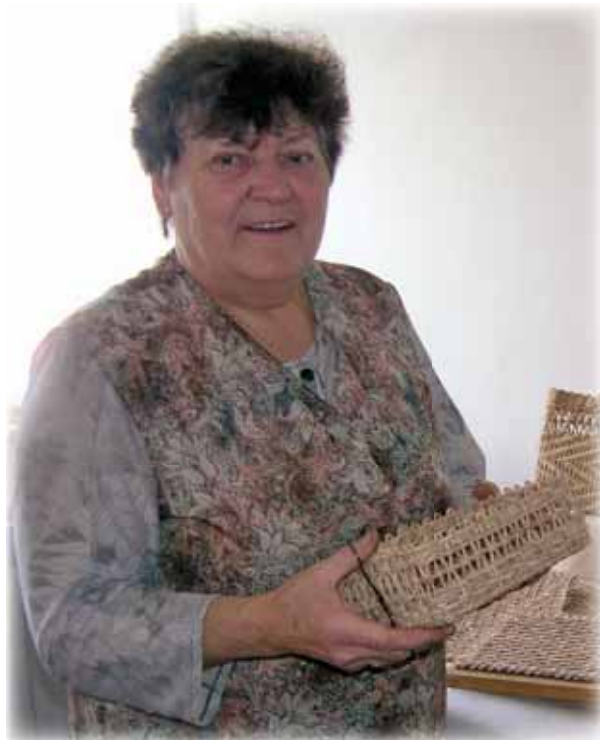
... pletení z kukuřičného šustí