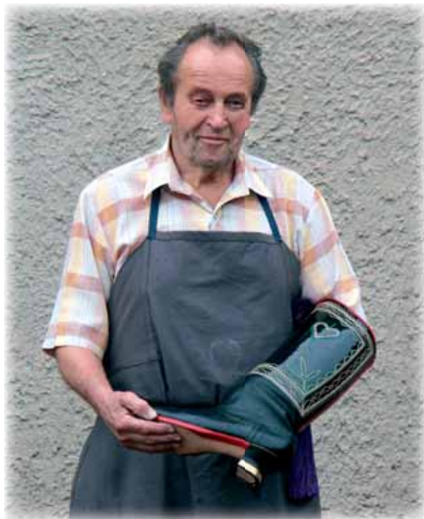
... výroba krojové obuvi