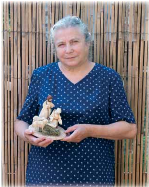
... výroba figurek z kukuřičného šustí