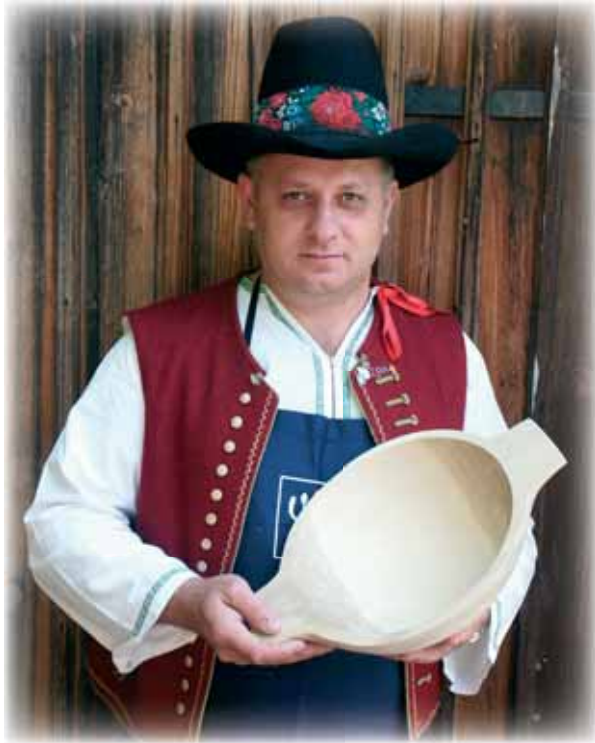
...výroba dlabaných nádob