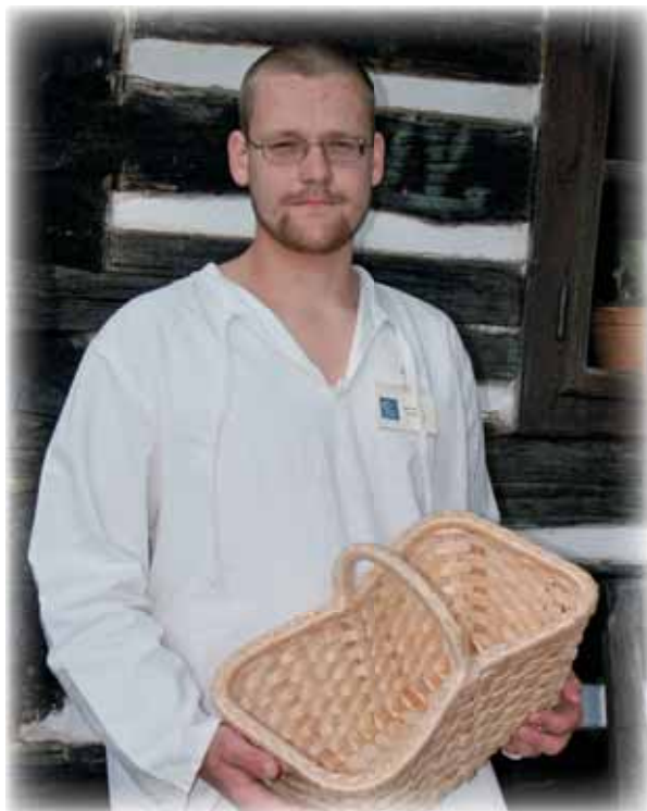
... pletení z loubků