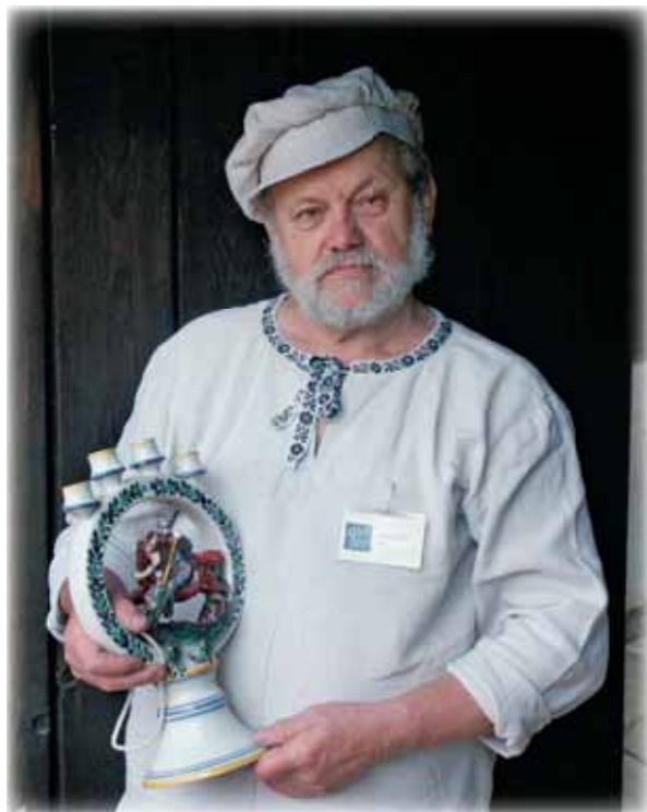
... výroba lidových fajánsí